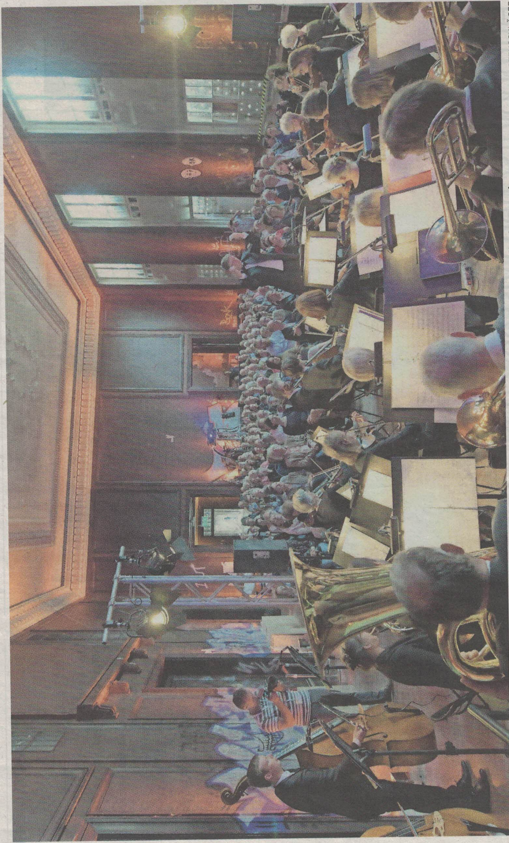
Zum Tag des offenen Denkmals gab es in Krampnitz im ehemaligen Offizierskasino ein Vorabendkonzert des Collegium musicum.